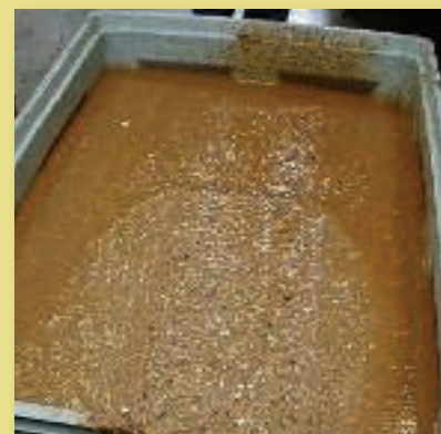
Conținut → producere biogaz

În Marea Britanie există firme specializate pe fiecare gen de produse, firme care colectează deșeurile din supermagazine și le valorifică în cel mai scurt timp, astfel încât acestea să nu ajungă să se degradeze mai mult.