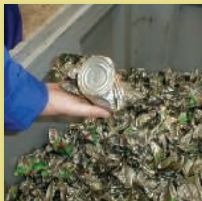
Ambalaj de reciclat