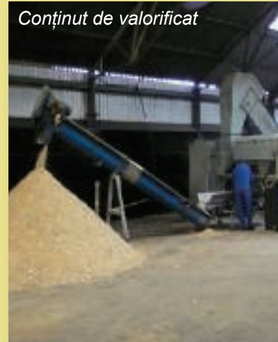
Conținut de valorificat

Turbo-separatorul se folosește la separarea oricăror materiale de ambalajul lor, dar se poate folosi și pentru alte scopuri.